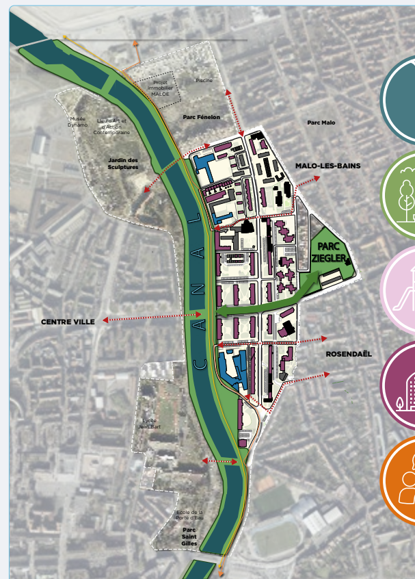
Schéma de principe - rapport d'étape - Septembre 2022

L'AGUR participe aussi activement aux divers temps d'information, de sensibilisation et de dialogue sur l'ensemble du projet (forums actus, écovillages...) ou sur des projets spécifiques (enquête préalable auprès des locataires de Partenord Habitat, projets d'extension du parc Ziegler et de la transformation de la rue Maurice Vincent en rue verte...)