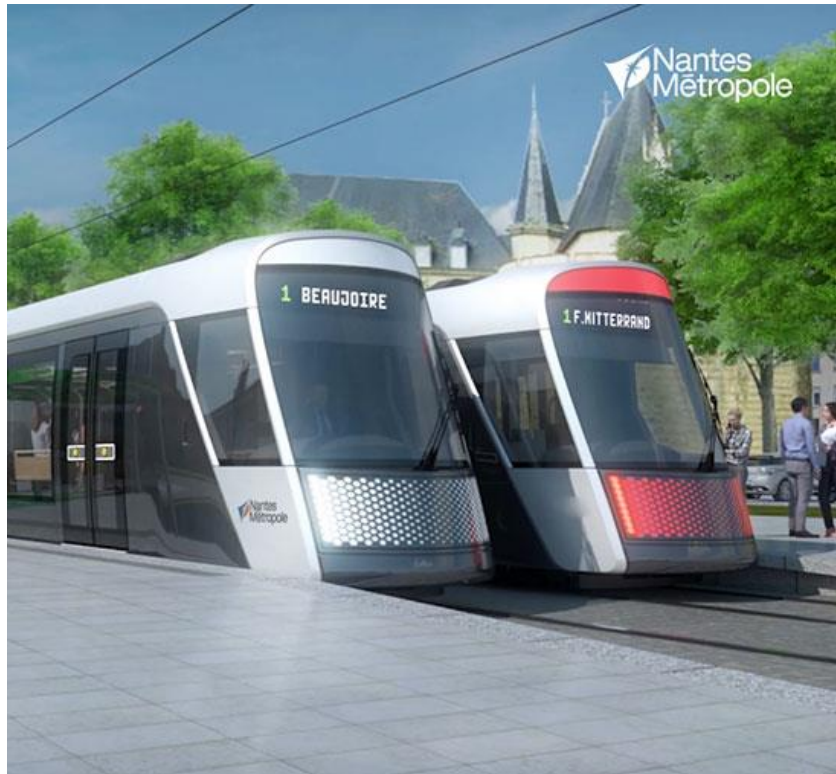
Figure 5 : Nouveau tramway nantais qui sillonnera la ville à partir de 2023

Les politiques actuelles en termes de transports urbains sont donc focalisées sur ces projets de lignes nouvelles (deux de tramway et une de busway) et sur des extensions de lignes de tramway existantes. Sur le long terme, l'objectif est de passer d'un réseau actuellement en étoile vers une configuration en toile d'araignée, pour préserver l'équilibre territorial et sortir d'une concentration trop forte sur le centre. En termes de matériel roulant, des tramways de forte capacité sont attendus pour remplacer des tramways nantais assez courts. Simultanément, la mise en service du e-busway est en cours : un véhicule de 24 m à trois caisses, destiné à augmenter la capacité de 25 000 à 40 000 voyageurs/jour sur la ligne 4 de busway alimentée par biberonnage électrique.