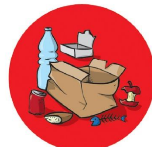
▲ Gestion des déchets