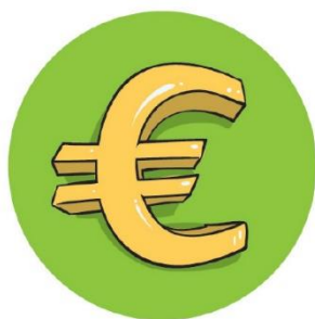
▲ Taxe Wateringues