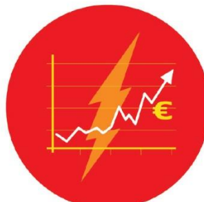
▲ Augmentation du coût de l'énergie