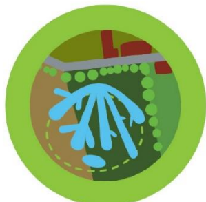
▲ Zone d'expansion de crue