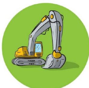
▲ Entretien du réseau hydraulique