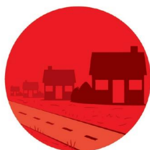
▲ Imperméabilisation des sols