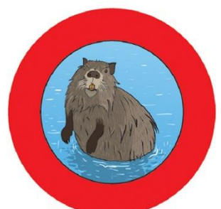
▲ Lutte contre le rat musqué